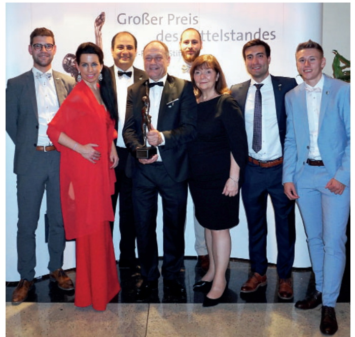
Ein Team der Ingenieurgesellschaft Patzke nahm den Preis in Düsseldorf entgegen.

Der seit 1994 jährliche ausgeschriebene Große Preis des Mittelstandes ist laut dem Urteil der Tageszeitung ‚Die Welt‘ „deutschlandweit die begehrteste Wirtschaftsauszeichnung.“ Fördern